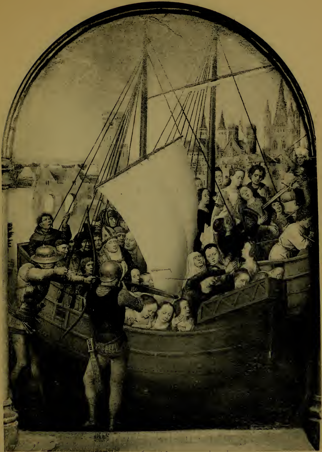
Le Martyre des Vierges Cinquième panneau de la Châsse de Ste-Ursule.